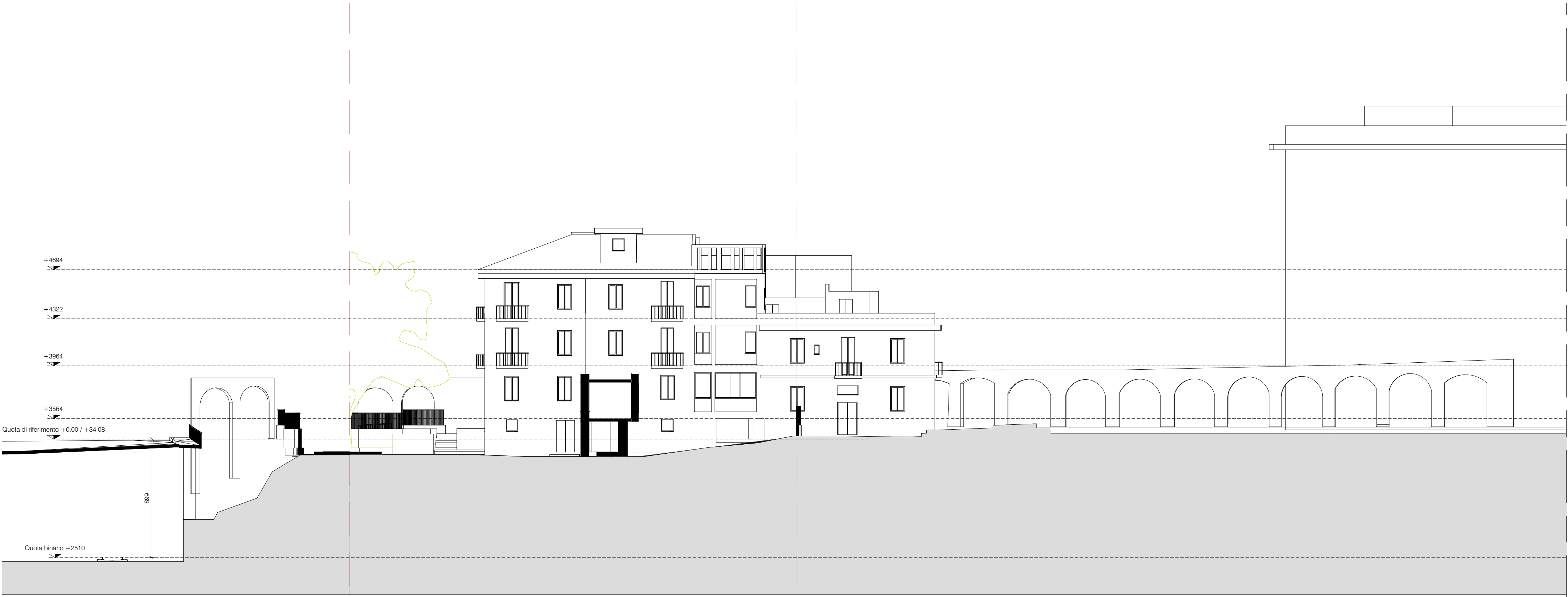
Profilo AA Scala 1:200