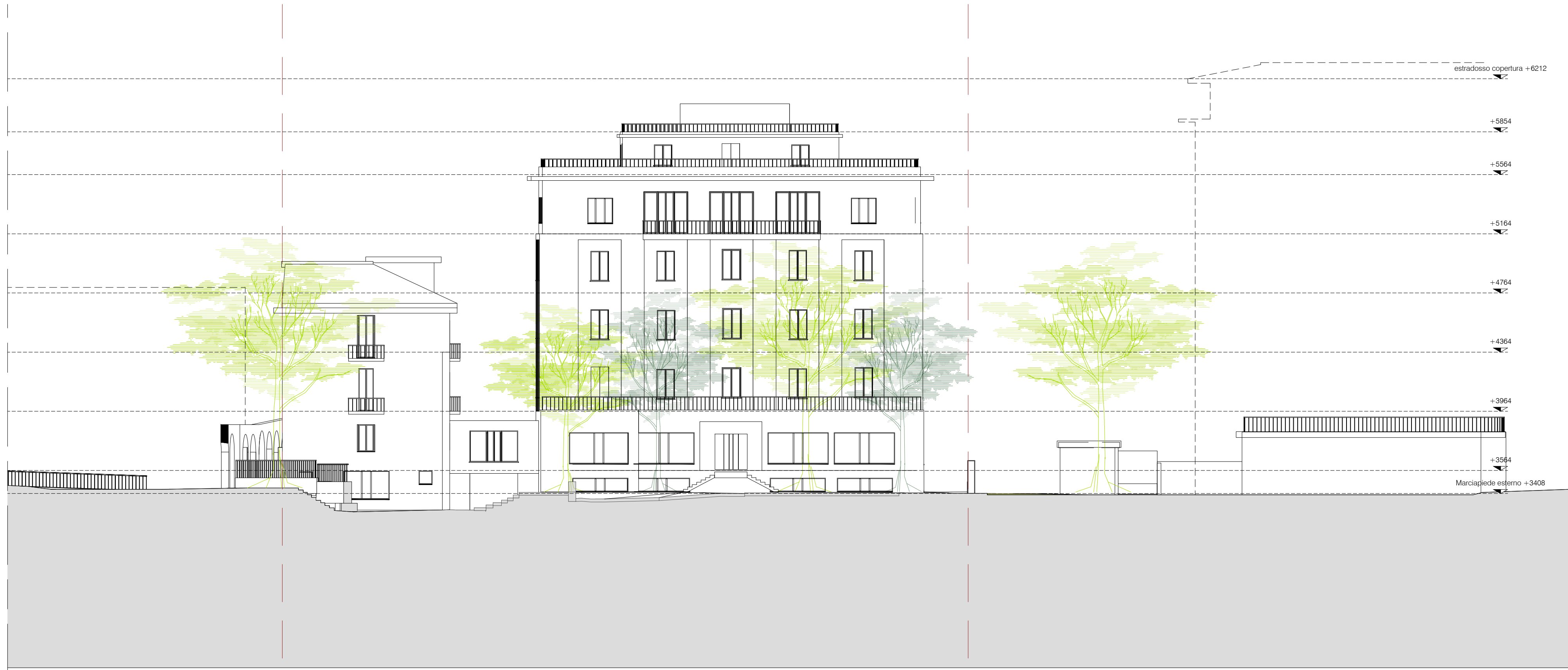
Profilo CC Scala 1:200