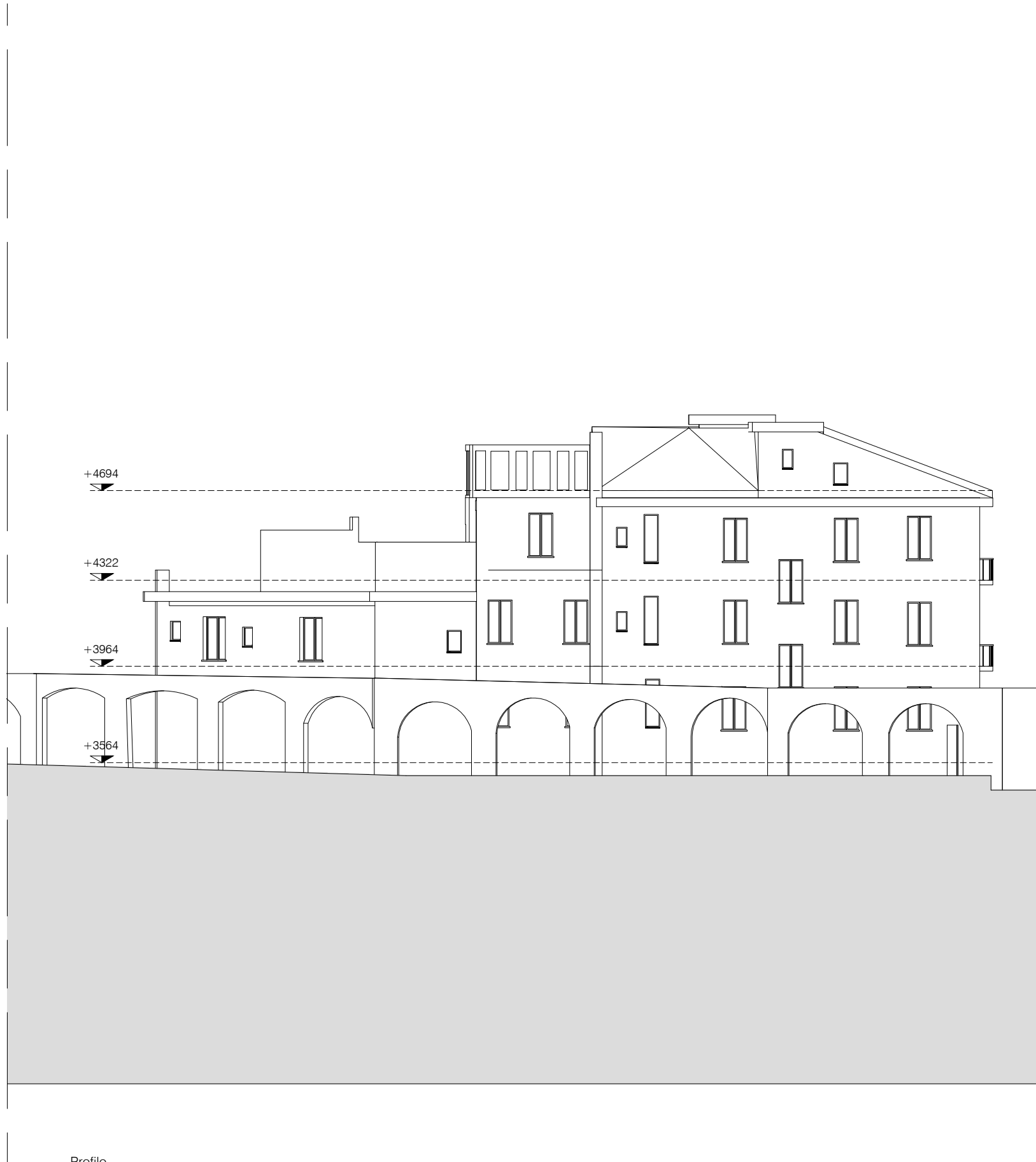
Profilo Scala 1:200