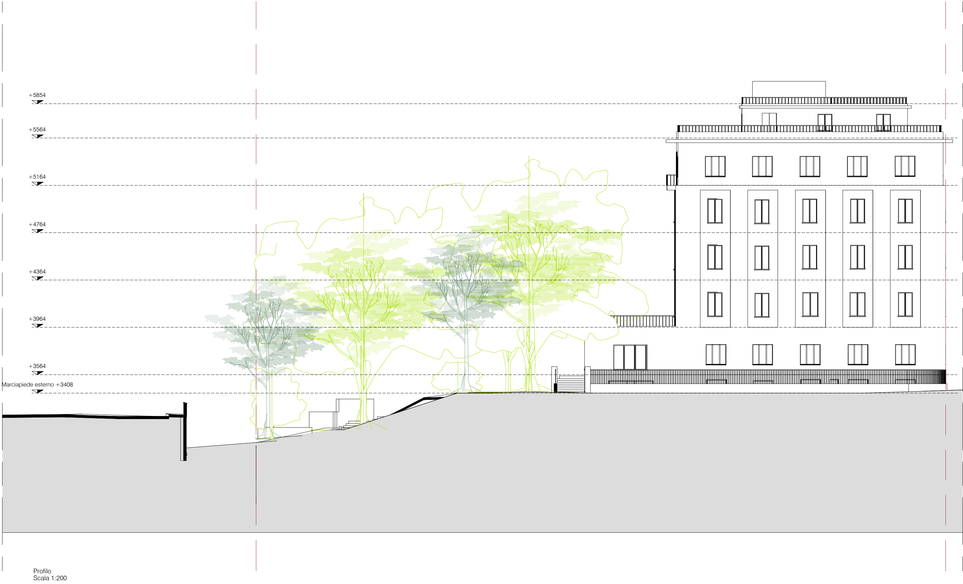
Profilo Scala 1:200