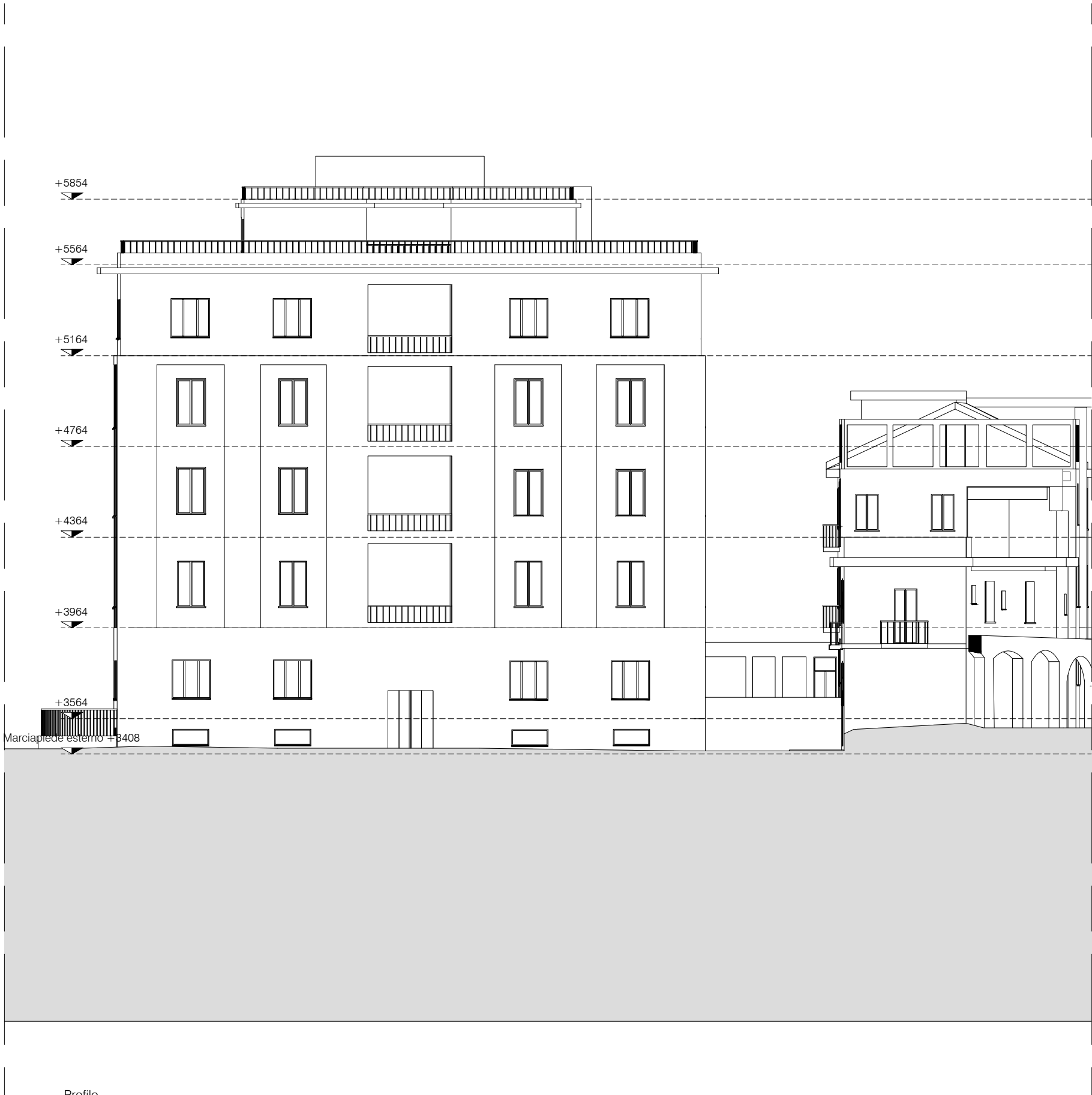
Profilo Scala 1:200